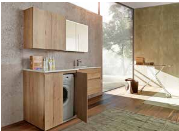
Die ästhetisch und funktional durchdachten Badmöbel-Lösungen von Conform Badmöbel mit Waschtisch-Unter-schränken für die Waschmaschine und enormem Stauraumangebot waren eines der Highlights auf der ISH.