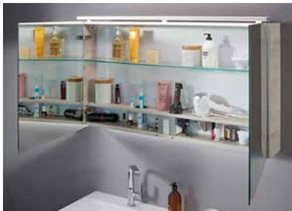
Intelio, der innovative, multifunktionale Spiegelschrank von Conform Badmöbel bietet Platz und Anschlüsse für alle elektrischen und elektronischen Geräte, die bei der täglichen Pflege verwendet werden.